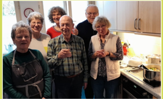
Kochgruppe 2 in Aktion